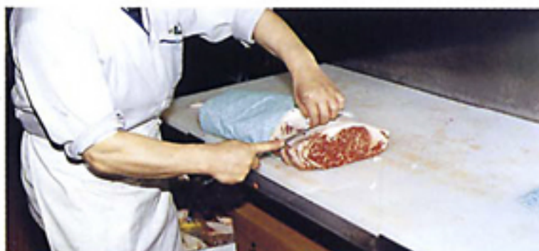
抗菌・抗カビ加工の不織布