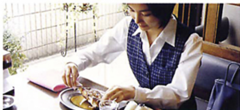
ケバ立ちが少なくタオルのようなボリューム感