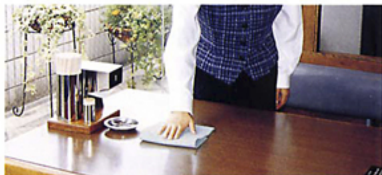
拭き取り機能に優れ乾燥も早く衛生的