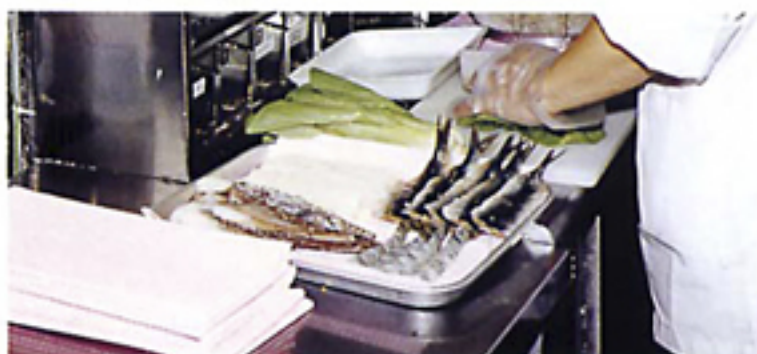
保水性・吸水性に優れています